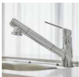
浄水器一体型混合水栓