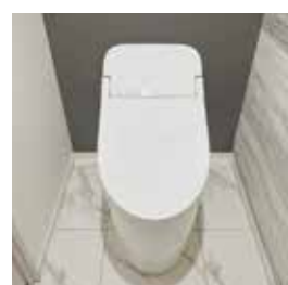
ロータンクシレットトイレ ※30A、30B、30C、30D、50A、50B、55A、55B、60A タイプは仕様異なります。