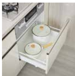
ソフトクローズ機能付きスライド収納 ※シンクの下は開き扉です。