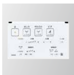
トイレリモコン ※30A、30B、30C、30D、50A、50B、55A、55B、60A タイプは仕様異なります。