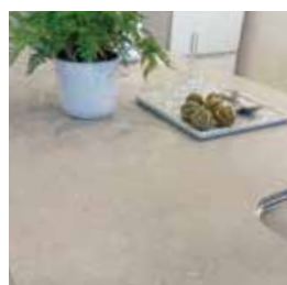
シーザーストーン天板