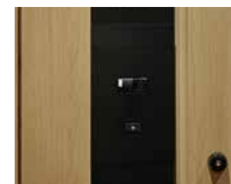
カメラ付玄関インターホン