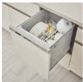
食器洗浄乾燥機 ※30A、30B、30C、30D タイプにはございません。