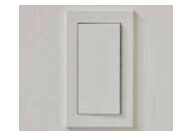
ワイドパネルスイッチ