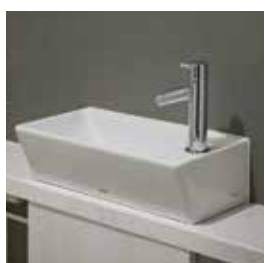
トイレカウンター ※30A、30B、30C、30D、50A、50B、55A、55B、60A タイプにはございません。