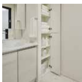
リネン庫 ※30A、30B タイプにはございません。