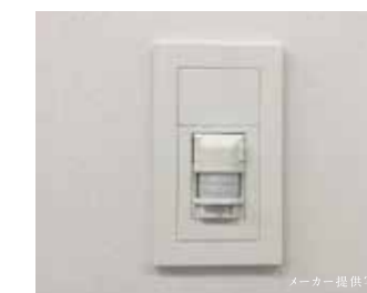
人感センサー付きオートライト(玄関部分)