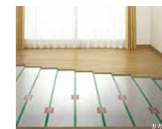
温水式床暖房(リビング・ダイニング) 参考写真