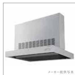
強制同時給排気型ステンレス製 レンジフード