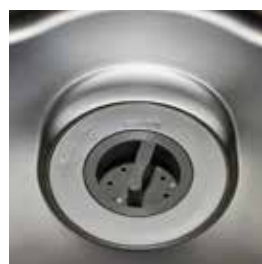
デイスローパー ※生ごみの種類によってはご使用できません。