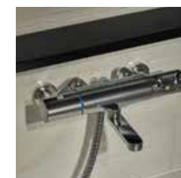
シャワー付き混合水栓