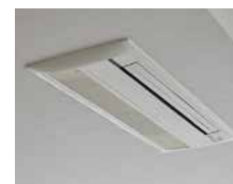
リビング・ダイニング 天井埋込カセット型エアコン 実装 ※90A、90B、95A、105A タイプのみの実装となります。