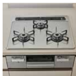
ガスコンロ ※30A、30B、30C、30D タイプは仕様異なります。 (2口タイプ)