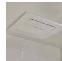
浴室暖房換気乾燥機・ミストサウナ